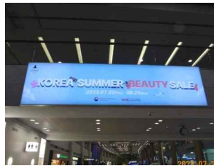
주요 지역 내 옥외광고 송출