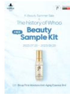
특별 프로모션 예시