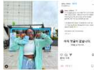
자원봉사단 활용 콘텐츠 확산